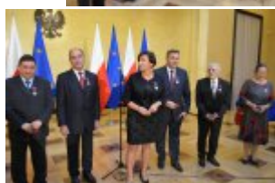
LII KWRiMNiE - grupowe zdjęcie odznaczonych

Podczas LII posiedzenia Komisji Wspólnej Rządu i Mniejszości Narodowych i Etnicznych, zorganizowanego z okazji dziesięciolecia funkcjonowania Komisji Wspólnej w Kancelarii Prezesa Rady Ministrów, na wniosek Ministra Administracji i Cyfryzacji siedem osób reprezentujących mniejszości narodowe i etniczne zostało odznaczonych Krzyżami Zasługi za działania na rzecz zachowania i rozwoju tożsamości kulturowej mniejszości narodowych i etnicznych.