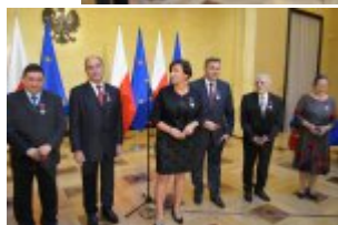
LII KWRiMNiE - grupowe zdjęcie odznaczonych

Podczas LII posiedzenia Komisji Wspólnej Rządu i Mniejszości Narodowych i Etnicznych, zorganizowanego z okazji dziesięciolecia funkcjonowania Komisji Wspólnej w Kancelarii Prezesa Rady Ministrów, na wniosek Ministra Administracji i Cyfryzacji siedem osób reprezentujących mniejszości narodowe i etniczne zostało odznaczonych Krzyżami Zasługi za działania na rzecz zachowania i rozwoju tożsamości kulturowej mniejszości narodowych i etnicznych.