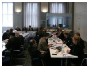
LIII KWRiMNiE - widok sali obrad

Na LIII posiedzeniu Komisji Wspólnej Rządu i Mniejszości Narodowych i Etnicznych, które odbyło się 16 grudnia 2015 r., informację w tej sprawie przekazało Ministerstwo Spraw Wewnętrznych i Administracji.